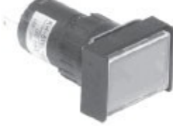
KH-516-B00 KH-516L-B00 직사각형