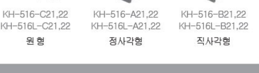
KH-516-C21,22 KH-516L-C21,22 원형