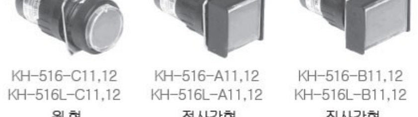
KH-516-C11,12 KH-516L-C11,12 원형