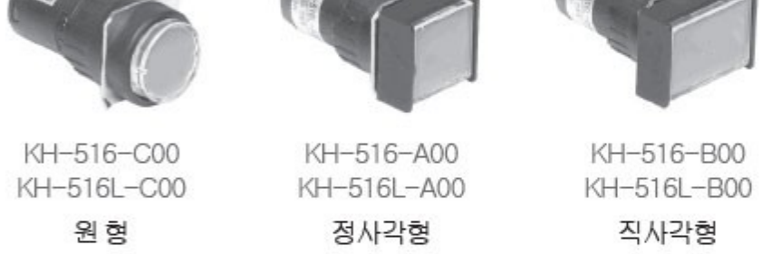
KH-516-C00 KH-516L-C00 원형